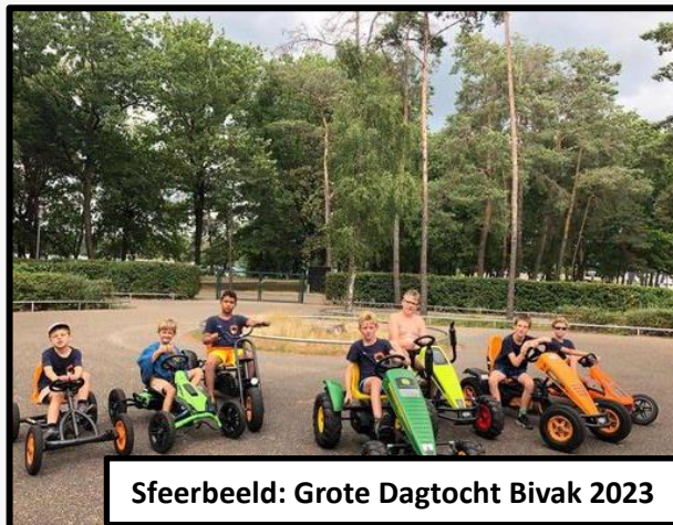
Sfeerbeeld: Grote Dagtocht Bivak 2023

Het is rond en het stuitert, we gaan alle soorten balsporten spelen.