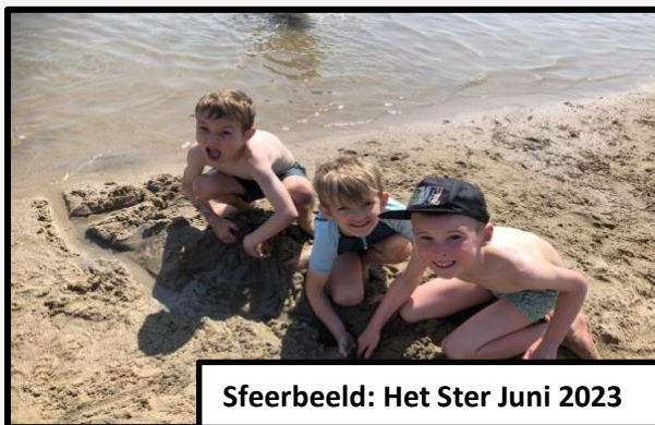
Sferbeeld: Het Ster Juni 2023

Zeg eens euh : Lukt het jou om geen euh te zeggen terwijl je aan het praten bent dan ga je hoger op het scorebord. Mislukt dit dan mogen de andere speelclubbers een natte spons in je gezicht gooien 😊